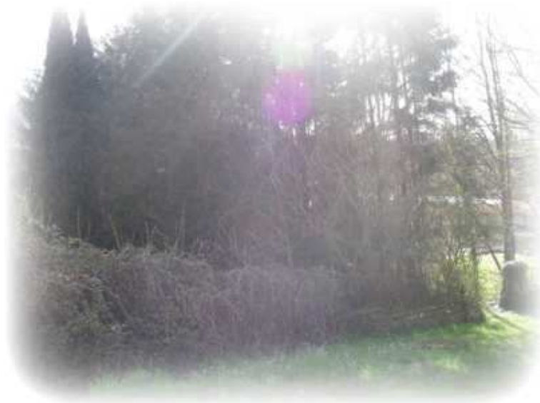
des ronces et des arbres qui ont bien grandi ... ( visite du village en avril 2008 )