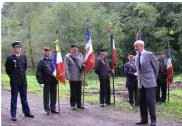
Cérémonie au monument Hagenhauer