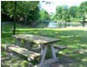
L'étang de la Digue

Viendront par la suite des travaux d'entretien du lit de la rivière qui permettront de maintenir et de parfaire la qualité des eaux et des paysages de la vallée.