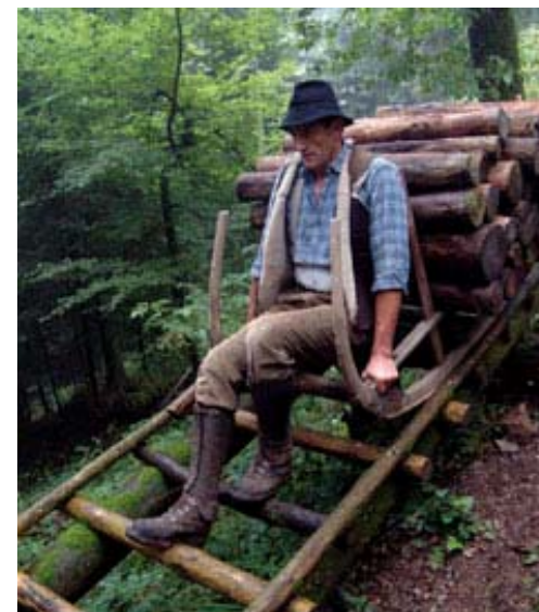
Fête du schlittage à Sapois en août 2009