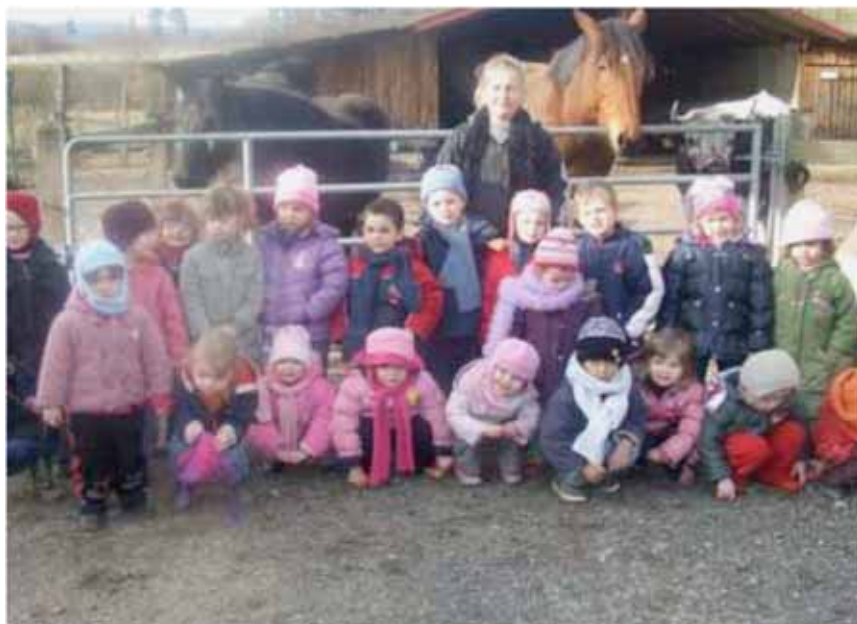
Visite à la ferme de la classe de maternelle